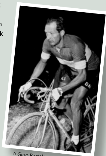
^ Gino Bartali, omstreeks 1945