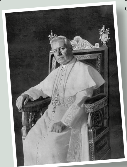
^ Paus Pius X

Dan begint de Tour de France. Het wielergekke land kent twee helden, die in vele opzichten elkaars tegenpolen zijn. Daar is Gino Bartali, winnaar van de Tour in 1938. Zoon van Toscane en diepgelovig katholiek. Het peloton noemt