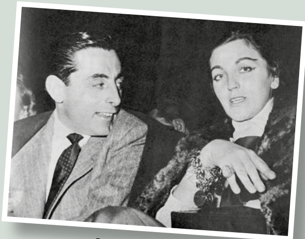
Fausto Coppi met de 'Witte Dame', nu in het zwart ^

hem 'De vrome', ook wel 'De monnik.' Het verhaal wil dat hij 's avonds na elke etappe een kokosmat opzoekt om er op zijn blote knieën de rozenkrans te bidden.