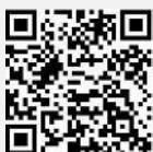
St. Stephanus Borne

U kunt dit doen door uw bijdrage over te maken op: